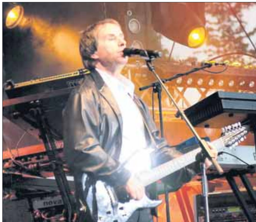
Zum Genießen: Chris de Burgh begann sein Konzert solo an der Gitarre.

Zwischenap-plaus gab es für kritische Kommentare zum Thema Krieg („Ich sehe nie Wei-seheit darin“), im Übrigen verlief der Abend so, wie es sich die gro-ße Fangemein-de des Iren wohl erhofft hatte: Sich für ein paar Stun-den von den Schwingen der sü-ßen Melancholie de Burghs davon-tragen lassen und einfach genießen.