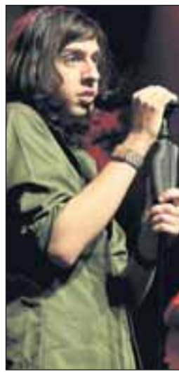
Vielseitig: Adam Green in Montreux.

Gratisveranstaltungen mitgezählt, dürften rund 230 000 Menschen die Konzerte und Veranstaltungen besucht haben, hieß es. Auch zur 40. Ausgabe des Festivals hatten sich Ausnahmekünstler angesagt,