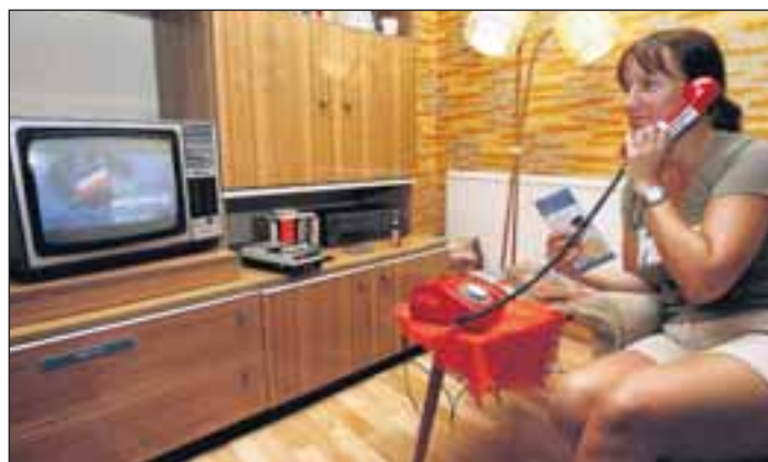
Alltags-Einblicke: Ein typisches Wohnzimmer des Ostens ist jetzt im Museum ausgestellt.

Die nächsten Termine im Kasseler Kulturzelt, Beginn jeweils 19.30 Uhr: heute: Anoushka Shankar, Mittwoch: Tower of Power, Donnerstag: The Bad Plus. Karten: 0561-203204.