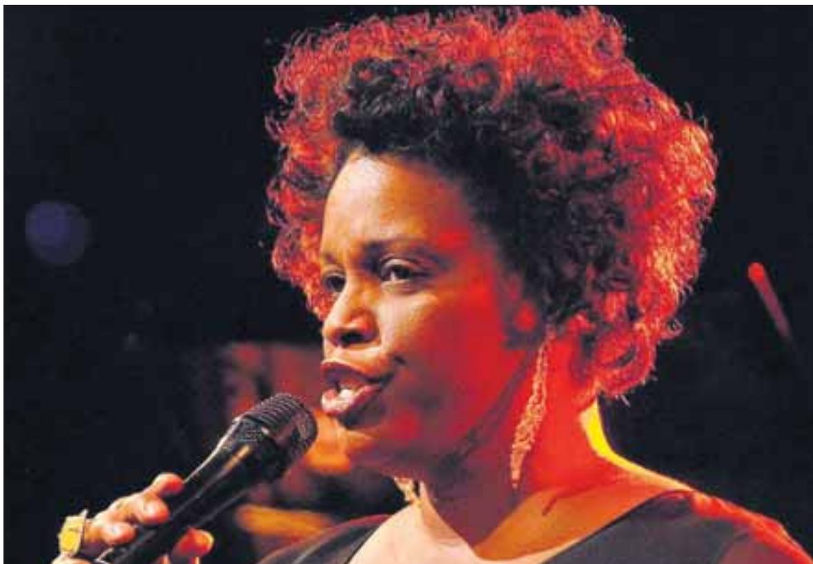
Unpräzise: Dianne Reeves bei ihrem Auftritt in Kassel.

Denn da ist eben ihre Stimme, die die untextierte Gesangs-Improvisation als Quelle schier unerschöpflicher Möglichkeiten nutzt. Die Sängerin mit dem bunt gemusterten Rock, der schwarzen Bluse und der unpräzisen Ausstrahlung lässt dann ihre Stimme grummeln wie eine Tuba, schmeicheln wie eine