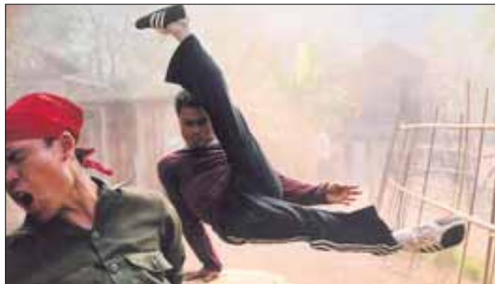
Mehr Action geht nicht: Szene aus Born to Fight.

Genre: Actionfilm Wertung: **** Altersfreigabe: ab 18 www.hna.de/kino