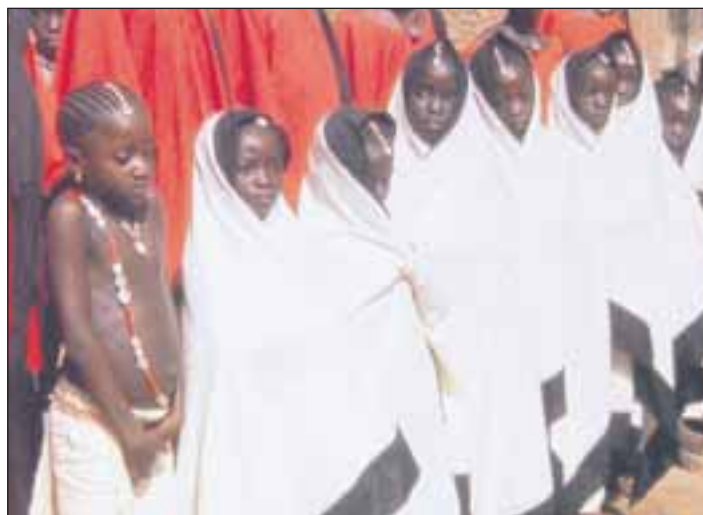
Angst: Diesen afrikanischen Mädchen im Film „Moolaadé“ sollen die Genitalien verstümmelt werden.