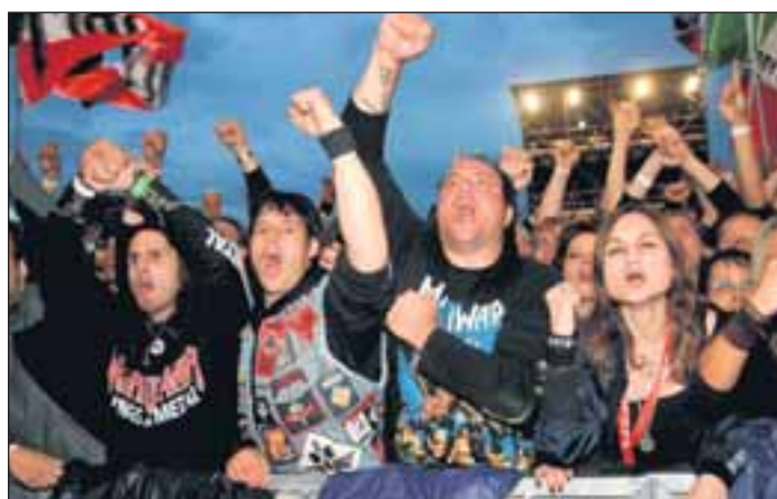
Lange Haare, schwarze Shirts und Kutten mit Band-Aufnahmen: Manowar-Fans in Bad Arolsen.

und Hollyhell. Dass es auf den Höhepunkt zuzug, kündigte eine Klassik-Symphonie mit Paukenschlag und feenhaftem Gesang an. Wie ein Gewitter polterten Manowar für zweieinhalb Stunden über die Bühne. Mit gellend hohen Schreien, quiurrenden Gitarren und Schlagzeugspiel im Techno-Rhythmus erneuerte die Metal-Legende ihren Anspruch, die lauteste Band der Welt zu sein. Sänger Eric Adams