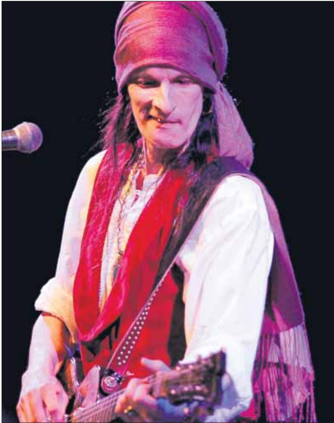
Südstaatenhitze statt Voodoo-Zauber: Willy DeVille spielte am Freitag im Kulturzelt.

An diesem schwülen Freitag bevorzugt Willy DeVille Stampfendes. Mississippi-Blues, Rock and Roll und Rhythm and Blues zaubern seine Leute lässig aus dem Hut, streuen dazwischen Altbekanntes und gut Abgehängenes wie „Hey Joe“ und „Demasiado Corazón“ ein.