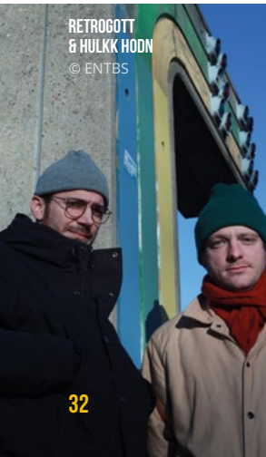
RETROGOTT & HULK HODN © ENTBS