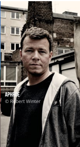
APHROE © Robert Winter